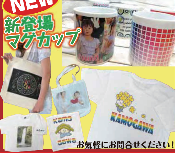
お気軽にお問合せください!