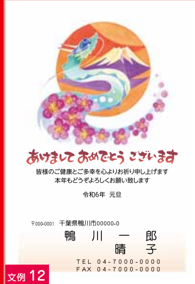
文例 12 会社むき文章