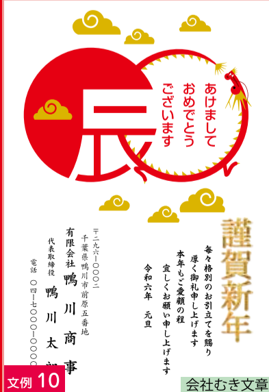
文例 10 会社むき文章