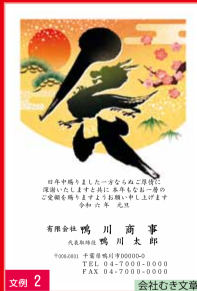
文例 2 会社むき文章