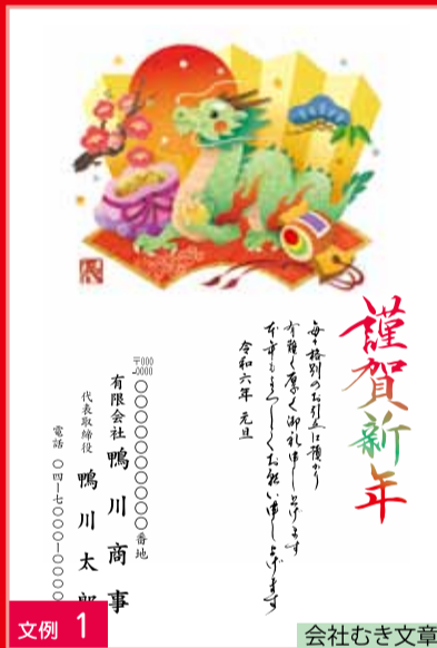
文例 1 会社むき文章