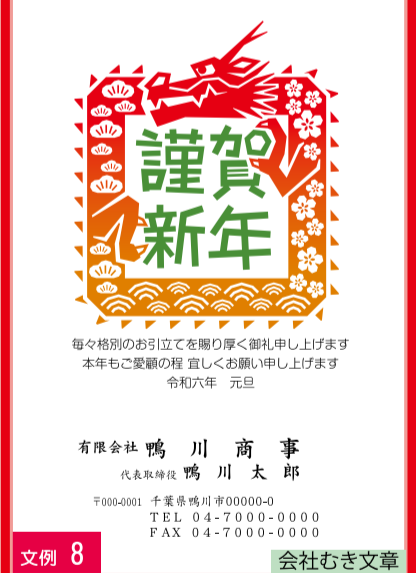
文例 8 会社むき文章