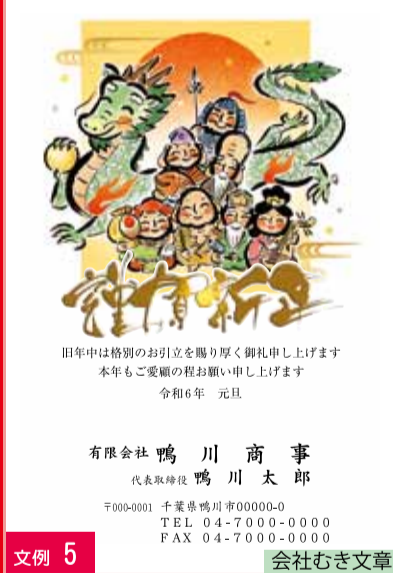
文例 5 会社むき文章