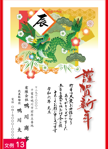
文例 13 会社むき文章