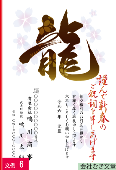
文例 6 会社むき文章