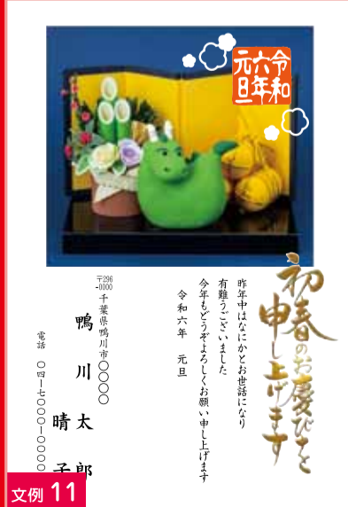
文例 11 会社むき文章