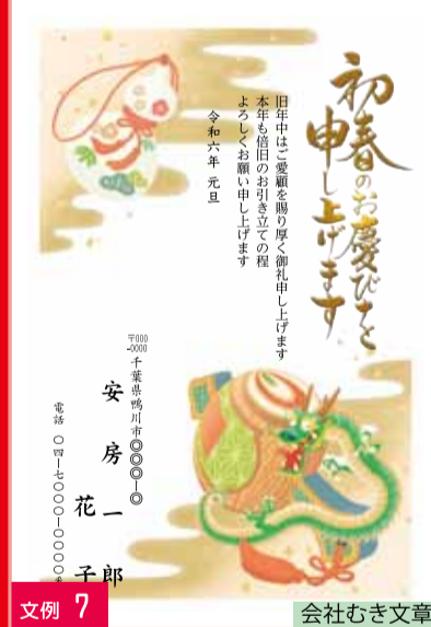
文例 7 会社むき文章