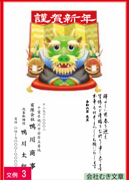
文例 3 会社むき文章