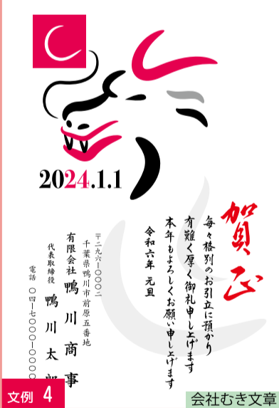
文例 4 会社むき文章