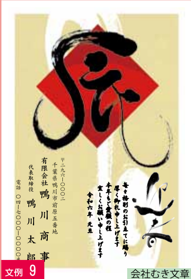
文例 9 会社むき文章